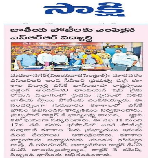
02/02/2024 | Vijayawada(Vijayawada Central) | Page : 3 Source : https://epaper.sakshi.com/