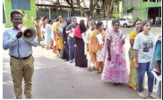
Exam time : Candidates appearing for Group-II prelims examination waiting in a queue outside examination centre, in Vijayawada on Sunday. G.N. RAO